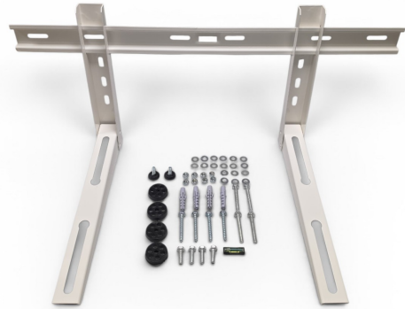
Ménsula con soporte (desarmable)