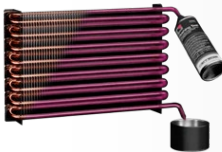
Si el color no cambia, encender el sistema