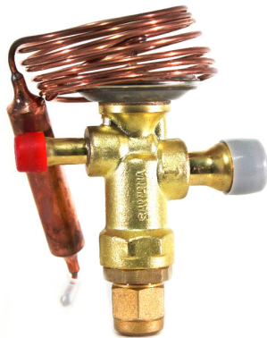
TABLA DE SELECCION

Las válvulas de expansión termostática serie RFGD se usan para ajustar la cantidad de refrigerante que entra en el evaporador, controlando al mismo tiempo el recalentamiento del refrigerante a la salida del mismo. Se pueden utilizar con varios refrigerantes en cualquier condición de trabajo. Aplicaciones posibles son sistemas de congelación, fabricantes de hielo, secaderos, así como aire acondicionado y bombas de calor en varios rangos de temperaturas.