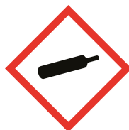
Gas a Presión